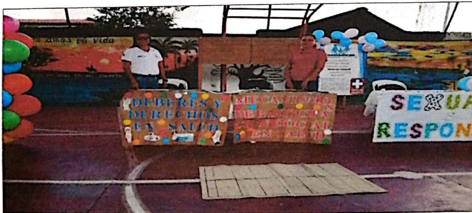
Colegio Nuestra Señora de Manare